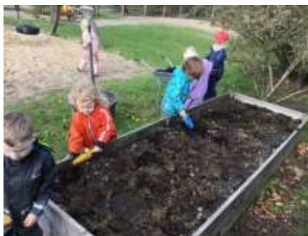
Børnene inddrages i klargøring af køkkenhaven og sætter kartofler

Børnene inddrages i, hvad vi skal dyrke i køkkenhaven og når vi høster anvendes grønsagerne i køkkenet til vores frokost. Børnene får lov til at sanse og eksperimentere, de føler sig værdifulde og de har noget særligt sammen med pædagogen, når de skal arbejde sammen og passe køkkenhaven.